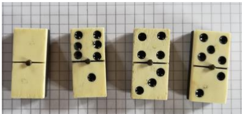
les dominos spéciaux appelés « matador »...

Ce sont eux qui seront posés perpendiculairement et non les doubles.